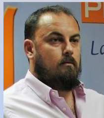
Israel Paredes Pacheco Pdte. Federación Aeronáutica y Aeroespacial