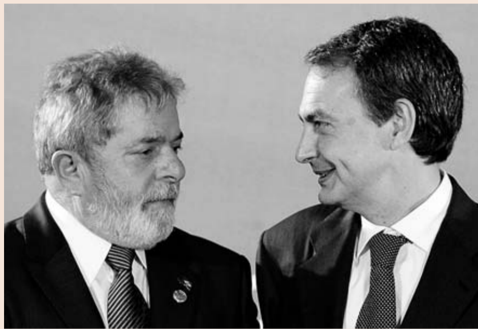
Los presidentes de Brasil y de España, Luiz Inácio Lula da Silva y José Luis Rodríguez Zapatero.

Un dinamismo que contrasta con la parálisis que sufre la economía española que, después de 7 trimestres en recesión, apenas pudo crecer en 1 y 2 décimas los primeros trimestres del año y no se descarta volver a tasas negativas a final de 2010. Aunque el impacto fue mucho más grave en la producción industrial brasileña, con una caída del 21% entre octubre y diciembre de 2008, el comercio mi-