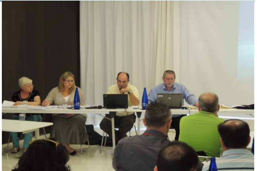
Mesa presidencial. De derecha a izquierda el secretario general, el presidente, la tesorera y la vicepresidenta de la Federación del Metal